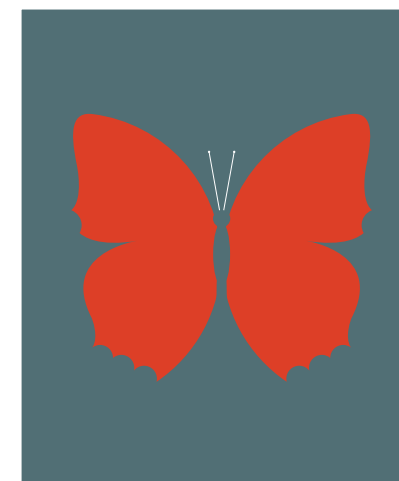
ZHUANGZI'S DREAM 莊子的夢想