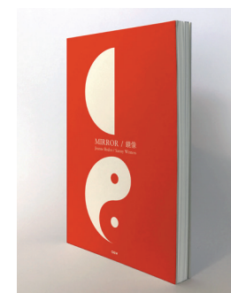
MIRROR / 鏡像 Jeanne Boden / Sanny Winters

‘Om diversiteit te kunnen herkennen moeten we eerst onszelf kunnen zien.’